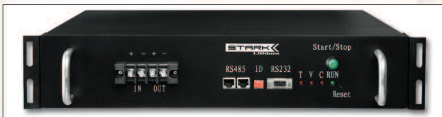
Литий-ионный аккумулятор ШТАРК ЛИА

Литий-ионные АБ могут быть встроены в оборудование или уста-