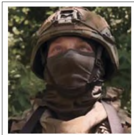
Железный: “Враг не пройдет, “птица” не пролетит”

В ходе очередного полета над правым берегом Днепра оператор беспилотника обнаружил гаубицу противника. В ходе контрбатарейной борьбы огнем нашей артиллерии гаубица была уничтожена. Поражение вражеского орудия зафиксировал расчет “Орлана”.